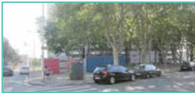
Quartier Pressensé - Bonnefond - Leynaud Place des Anciens Combattants angle rue Sarrazin/rue Denis