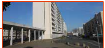
Quartier Millon - Grange Rouge 26 rue du Professeur Tavernier