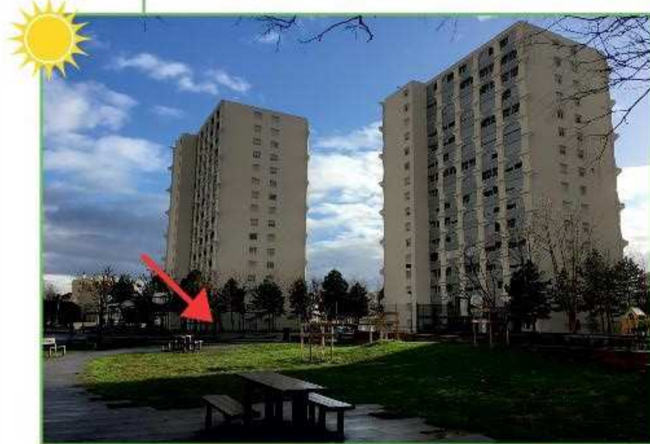
Résidence Maurice Langlet - Parc Nelson Mandela à proximité du 106 av. Paul Santy, vers le terrain de basket, au milieu des immeubles

L'action de l'ACEPP Rhône s'appuie sur la collaboration parents/professionnels, l'accueil et le respect de la diversité, la participation à la vie locale et citoyenne. Elle propose des actions privilégiant la démarche participative, la vie associative, la place des parents et la qualité de l'accueil de l'enfant.