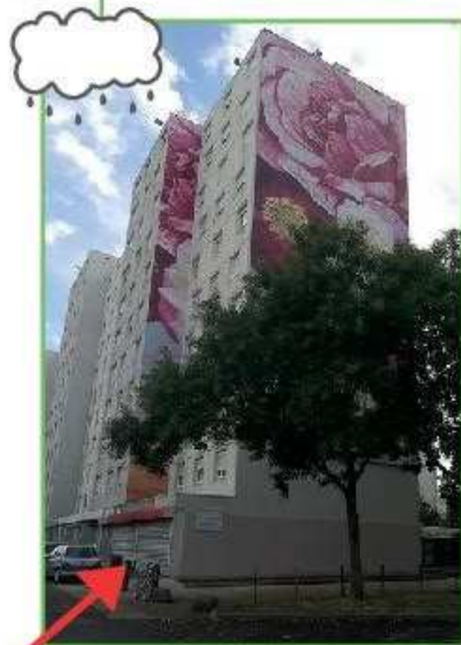
Local 108 108 av. Paul Santy