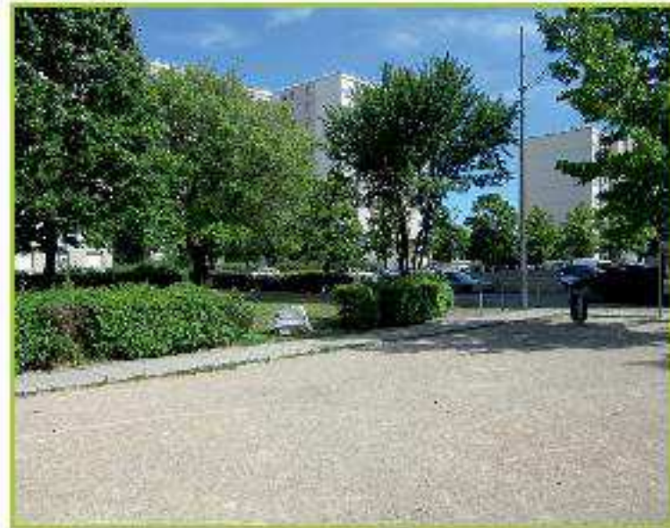
Quartier du Prainet sur le terrain de pétanque

En cas de pluie ou de grand froid, les temps Ballad'ou se déroulent dans L'Espace Michel MARILLAT 8 Avenue Salvador Allende (sous la crèche les Pitchounets)